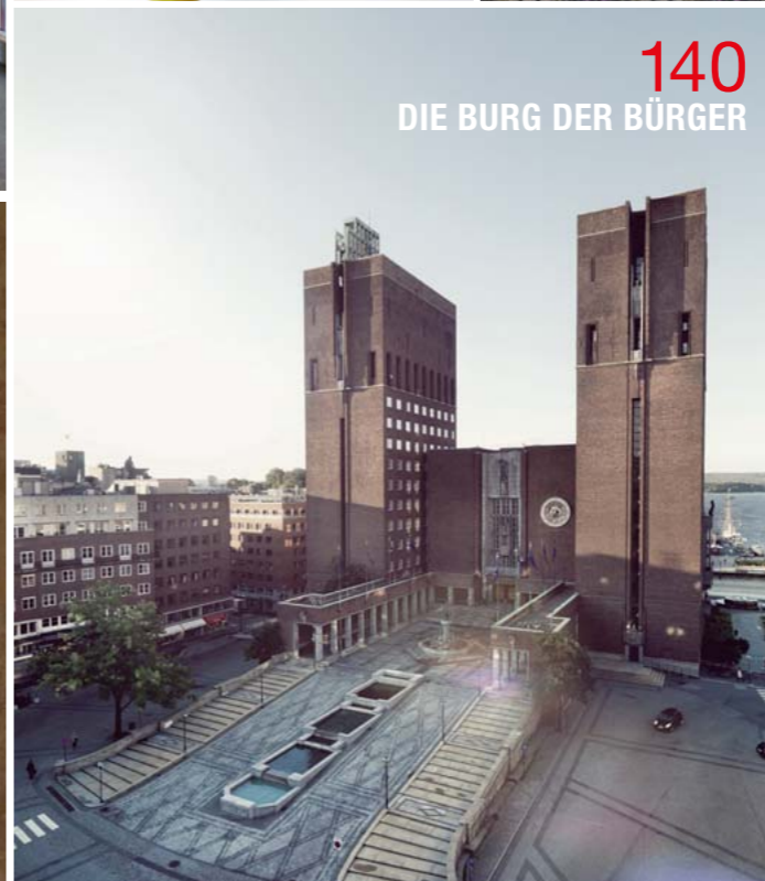
140 DIE BURG DER BÜRGER