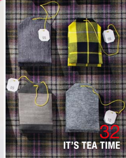
32 IT'S TEA TIME