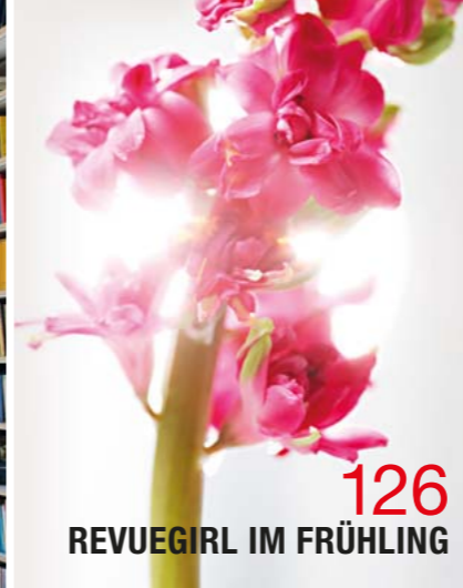
126 REVUEGIRL IM FRÜHLING