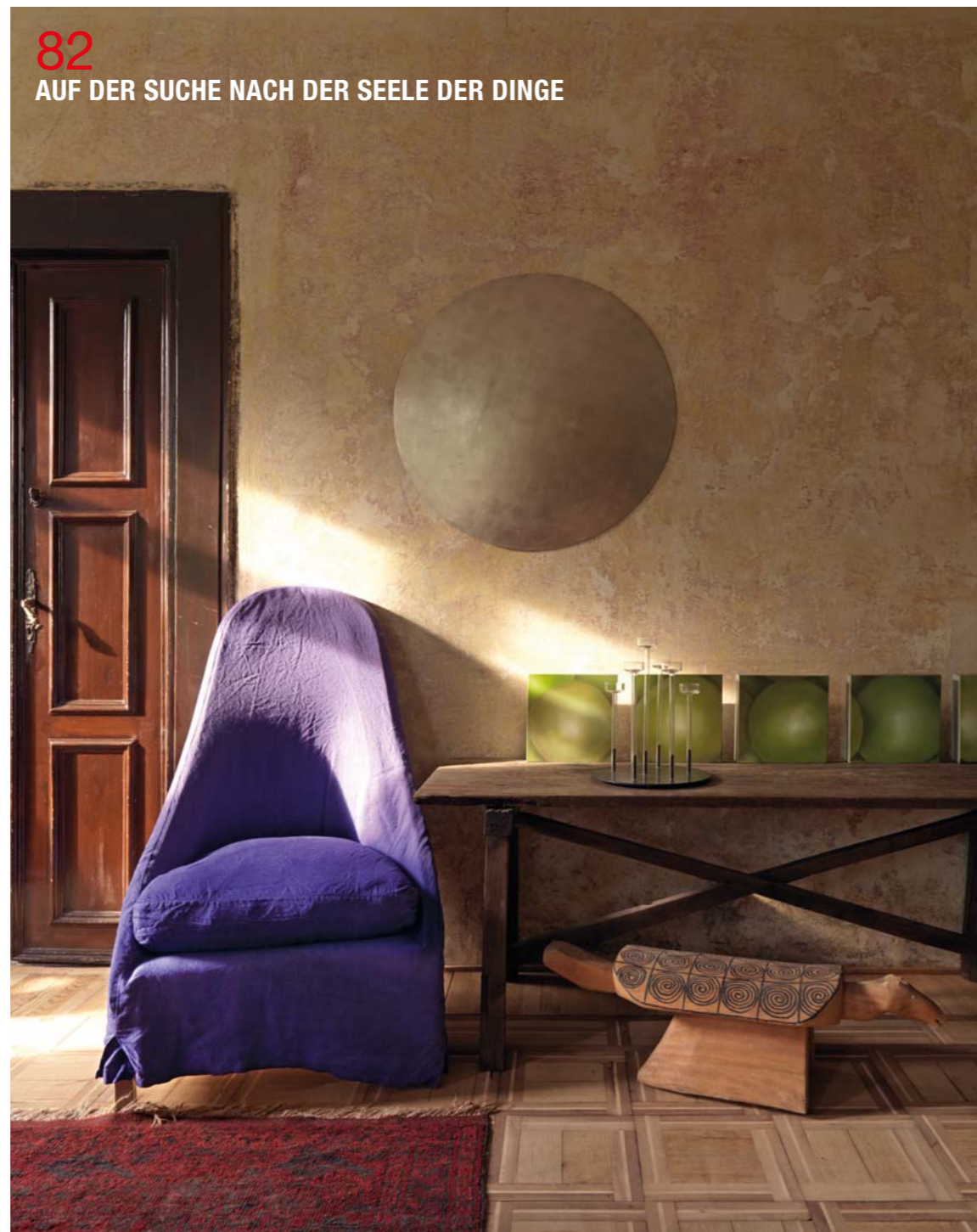
82 AUF DER SUCHE NACH DER SEELE DER DINGE