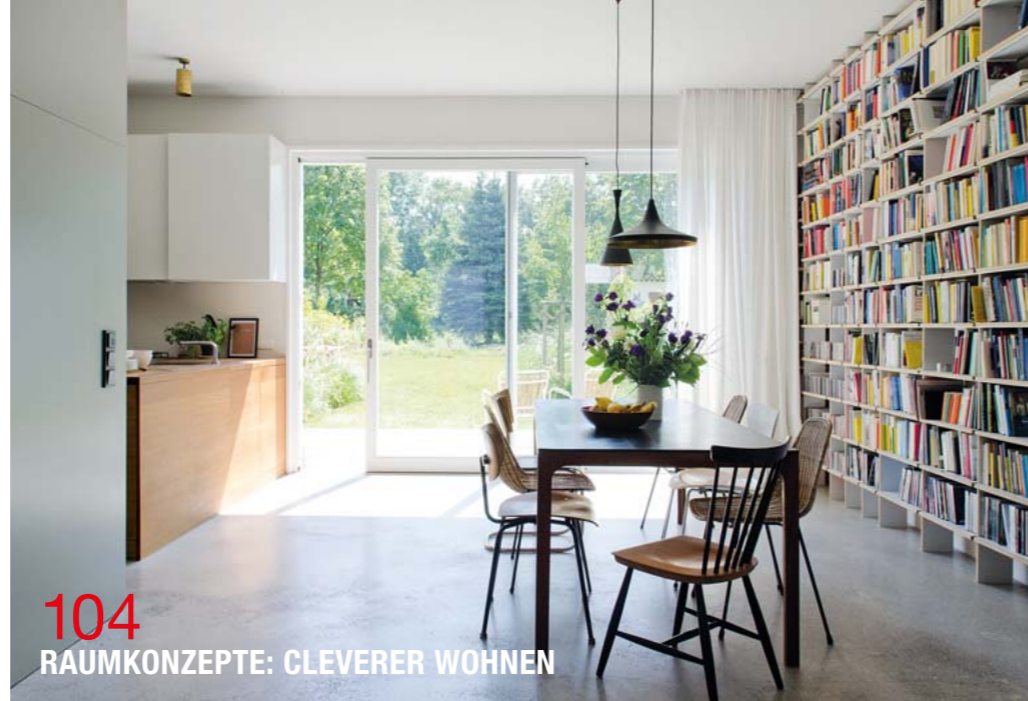
104 RAUMKONZEPTE: CLEVERER WOHNEN